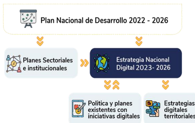
Figura 1. Construcción y articulación de la Estrategia Nacional Digital de Colombia 2023 – 2026

Por lo anterior, la END 2023 – 2026 aborda no solo las iniciativas que estará implementando el MinTIC, ente rector del sector de las Tecnologías de la Información y las Comunicaciones (TIC) y por tanto pilar de esta estrategia, sino también aquellas que estarán desarrollando las otras entidades del Gobierno nacional para impulsar la transformación digital de sus sectores. Lo anterior, entendiendo que la transformación digital es una apuesta a nivel país que involucra y requiere los esfuerzos de todos los sectores.